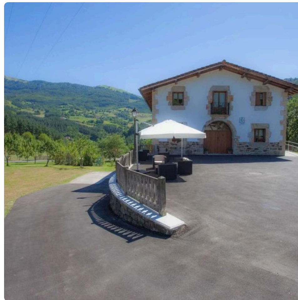
Casa Rural Aregi (Oñate)